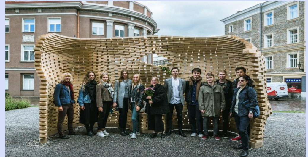
Varjualune „Sopid“ Tallinn, 2017