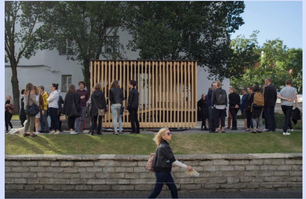
Varjualune „Lugeja“ Tallinn, 2015